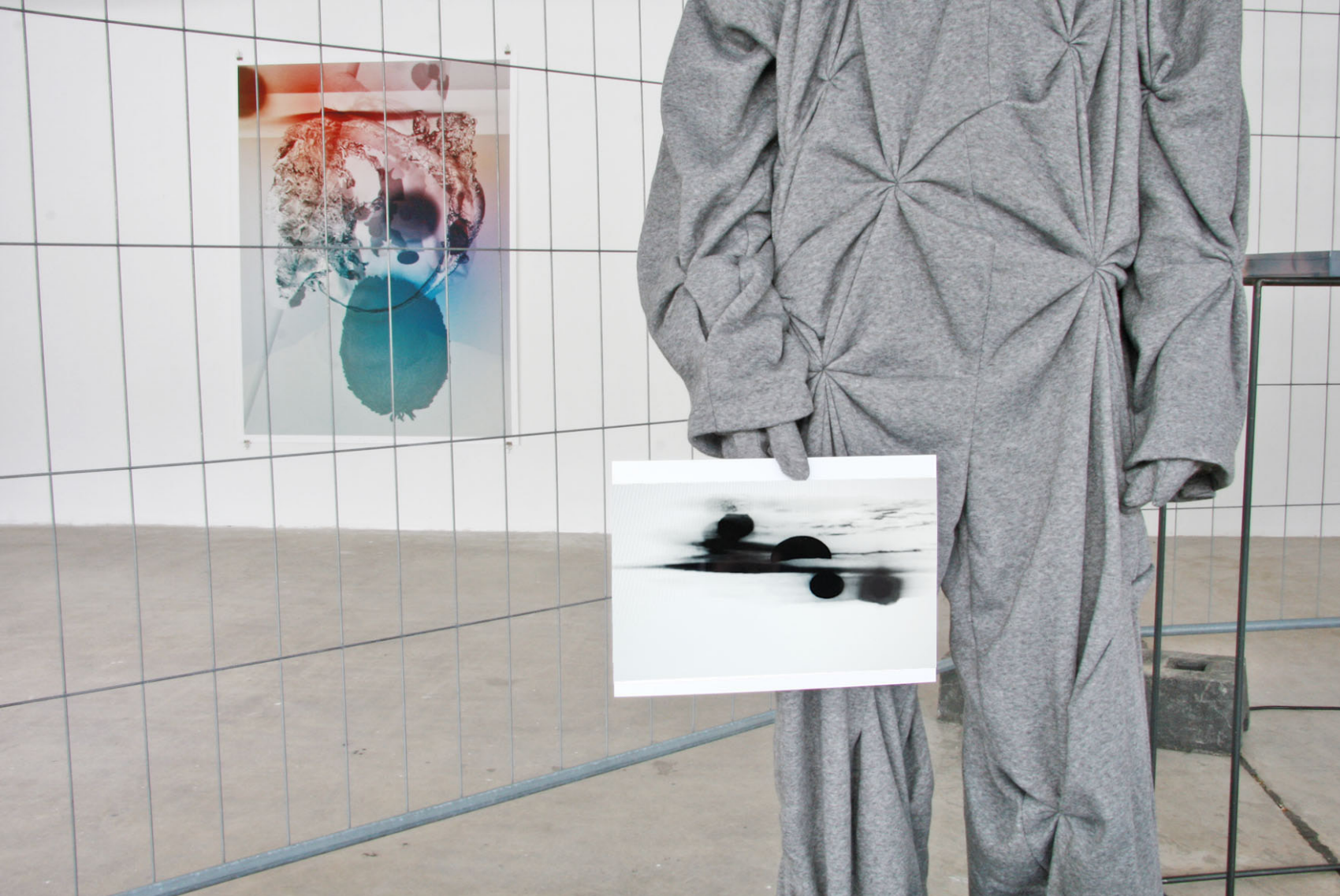
ETAGE, Lilli Federer, hello, world (planets I), 2093, Video, 4:29 min