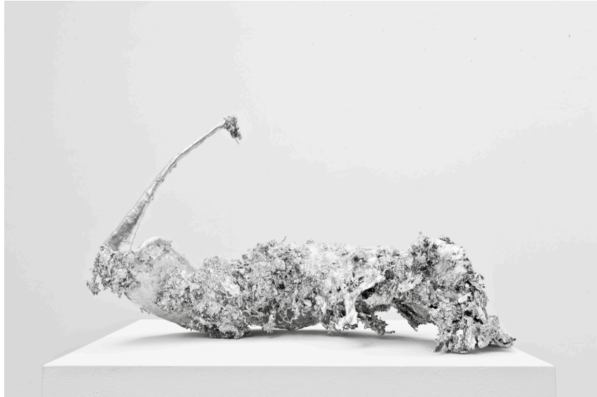
ETAGE, Lilli Federer, O.R., 2008 , 27 x 50 x 26 cm, Blei-, Zinnguss