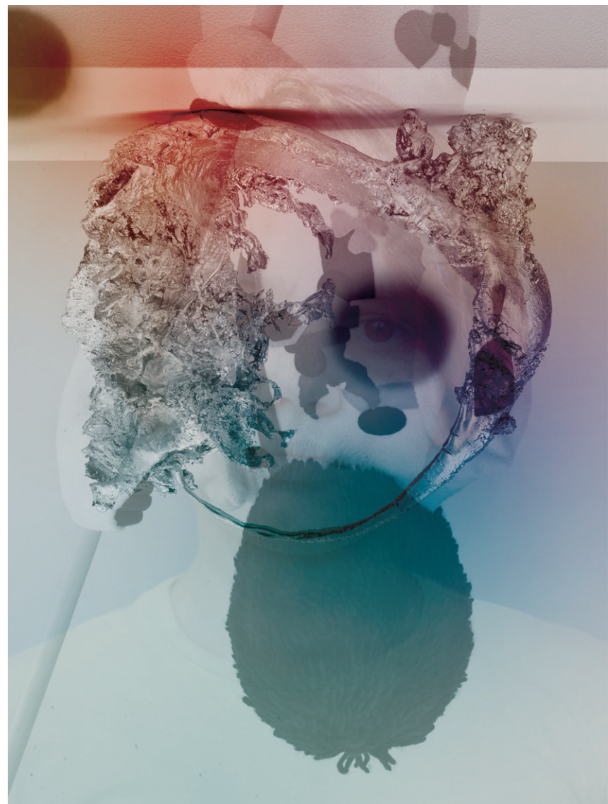
ETAGE, Paolo Larson, Cluster I – IV, 2148, Fine-Art Print, 126 cm x 166 cm