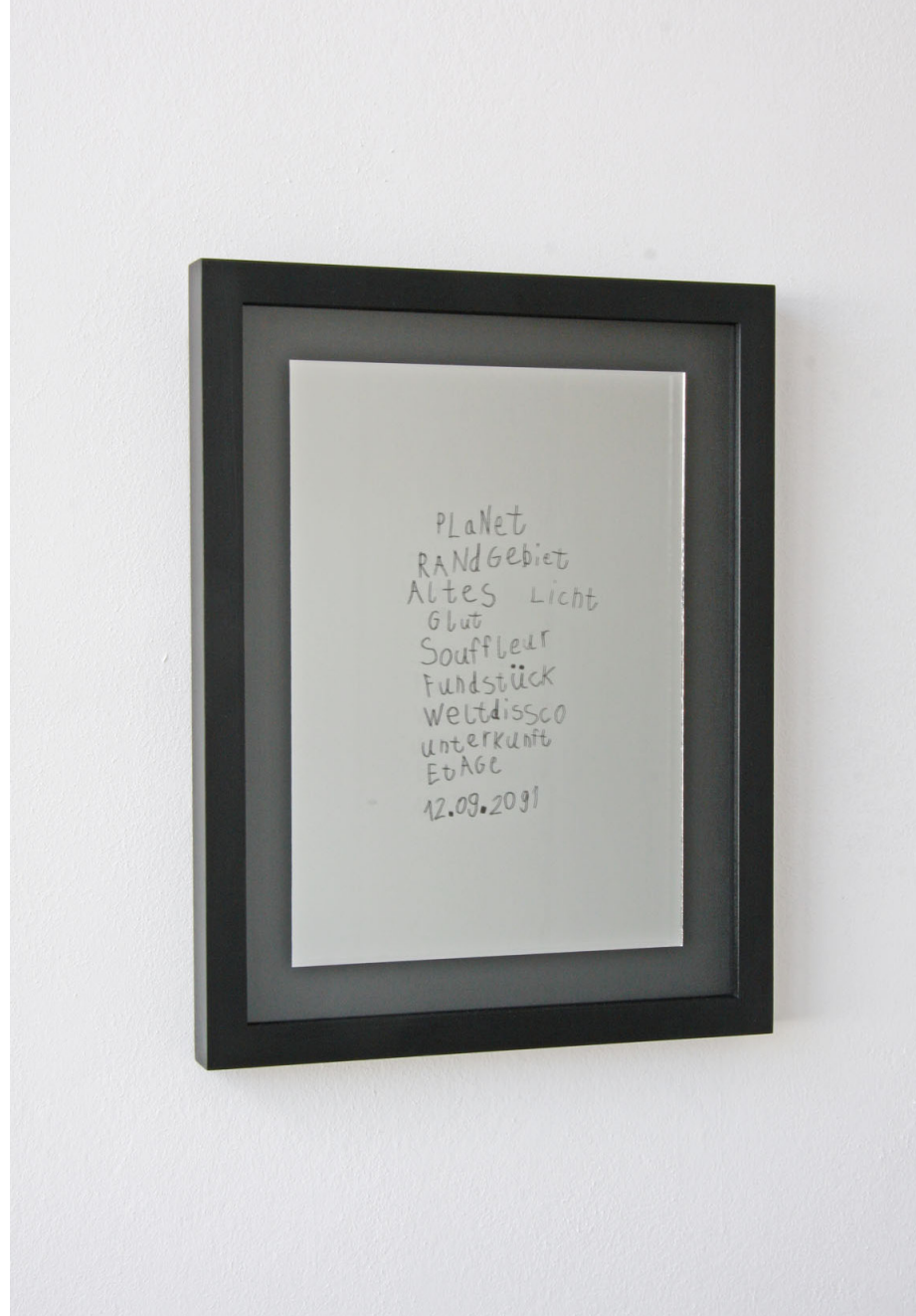
ETAGE, Weltdisco, 2091, UV-Direktdruck, Spiegel, 30 cm x 39 cm