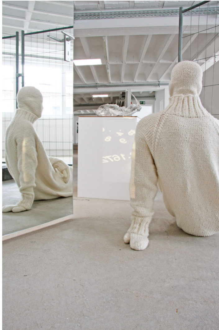
ETAGE, Castor Lubjak, Figur und Flagge aus IDO, 2081