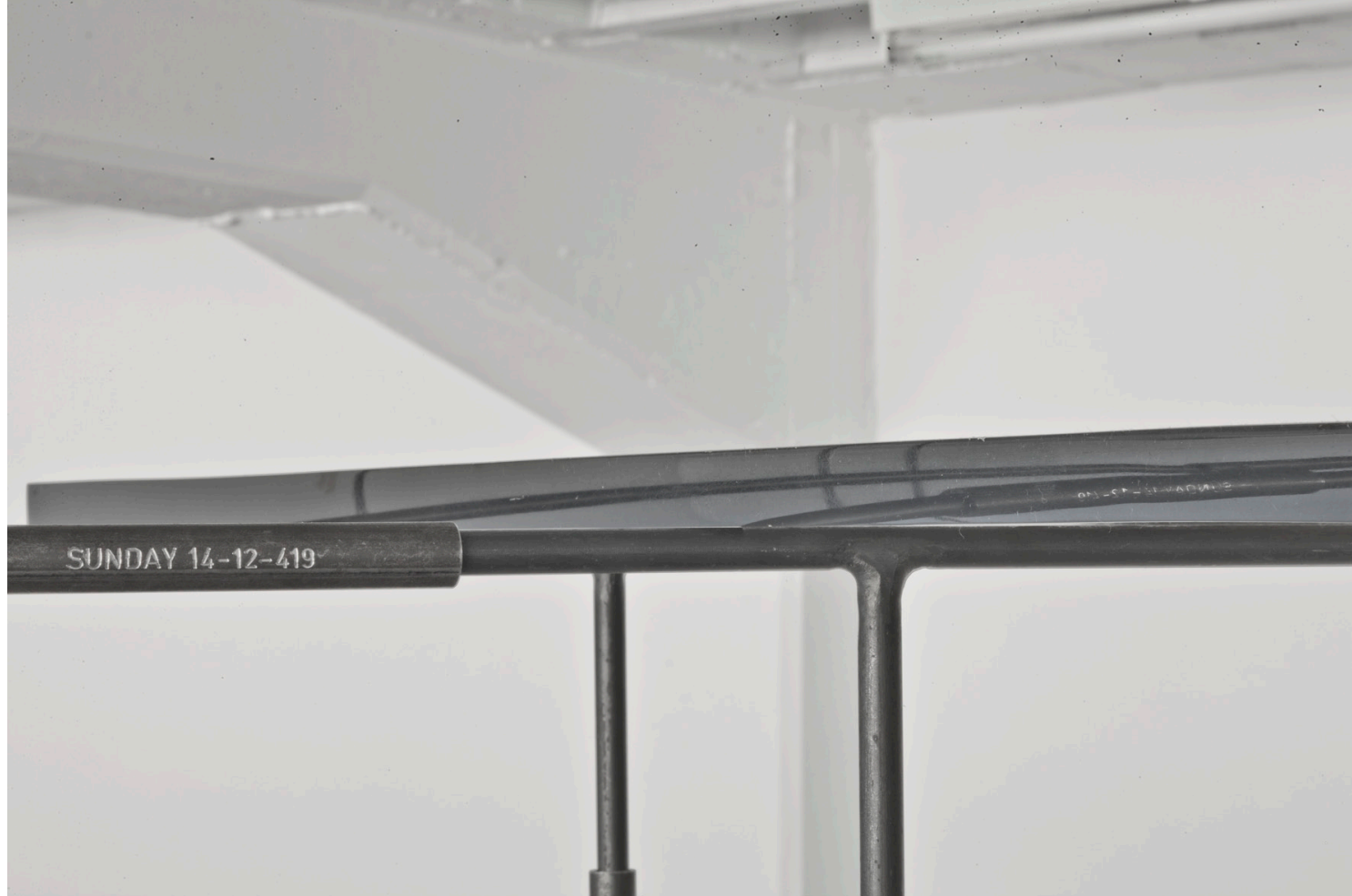
ETAGE, Lilli Federer, Dispersible Dust, 2006, Stahl, Gießharz, Staub, 210 x 340 x 140 cm