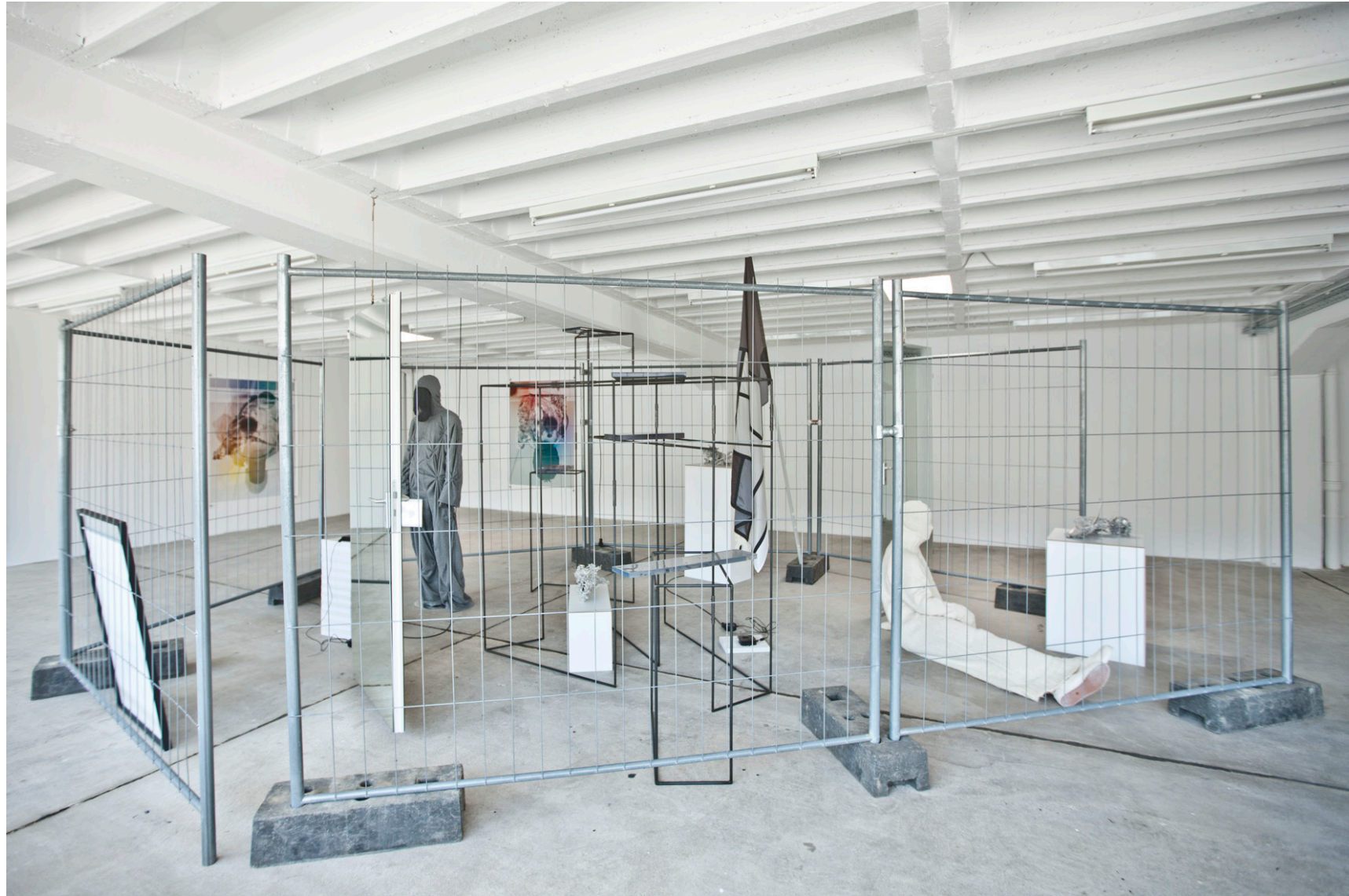
ETAGE / ERINNERUNGEN AN DIE ZUKUNFT Installationsansicht