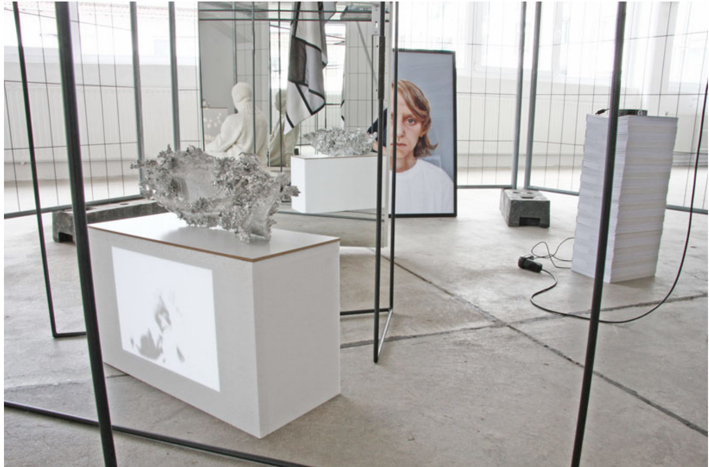
ETAGE, Lilli Federer, M.K., 2098 , 20 x 58 x 25 cm, Blei-, Zinnguss ETAGE, Paolo Larson, Past Mask Piece, 2142, Lambda-Abzug, Acrylglas , 70 x 100 cm