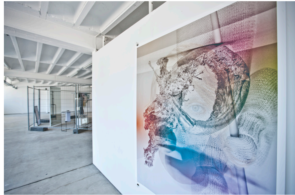
ETAGE, Paolo Larson, Cluster I – IV, 2148, Fine-Art Print, 126 cm x 166 cm